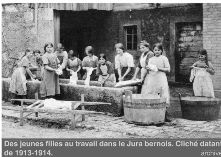
Des jeunes filles au travail dans le Jura bernois. Cliché datant de 1913-1914.